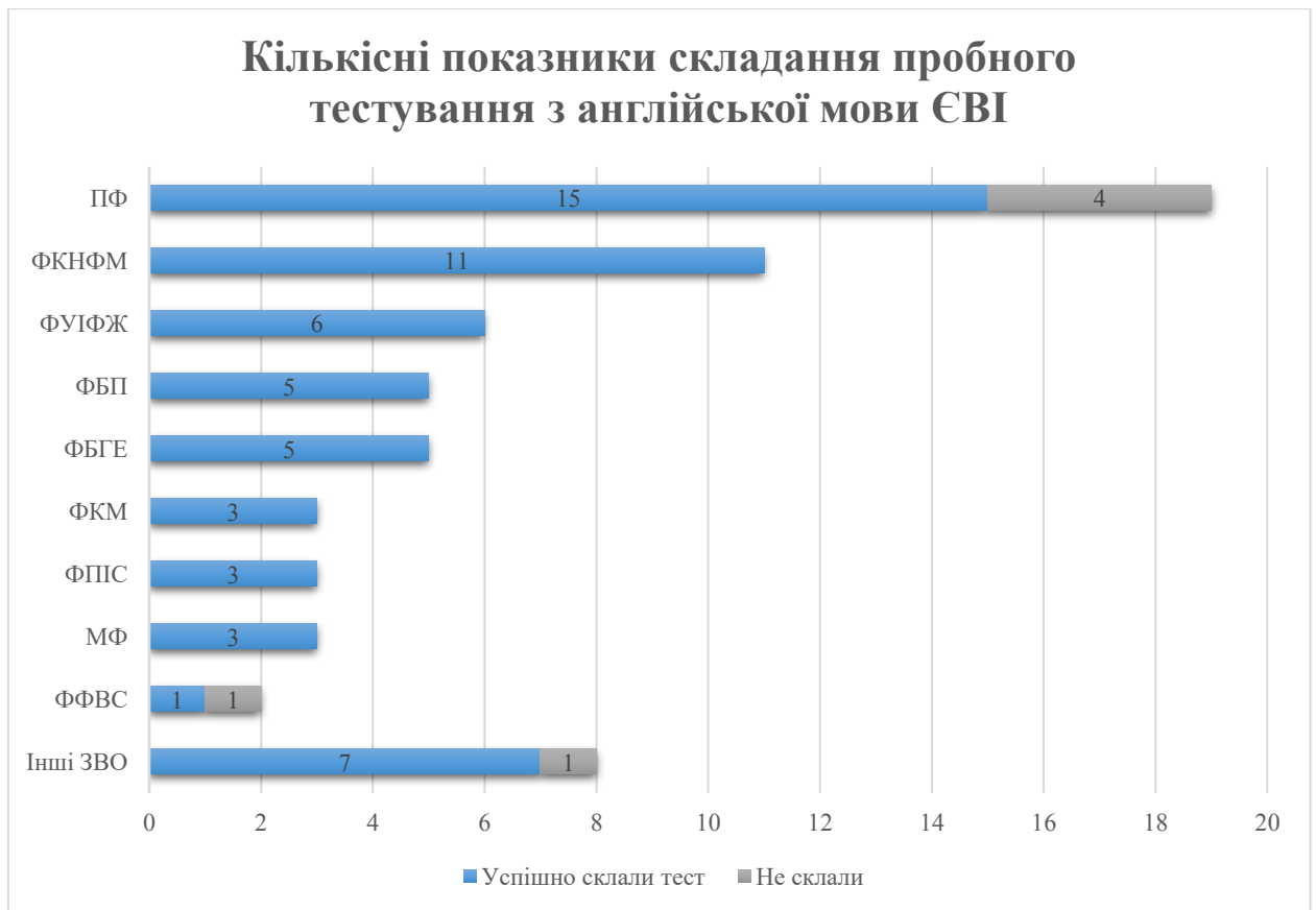
Рис. 2. Кількість учасників пробного тестування з англійської мови ЄВІ-2023 за факультетами університету